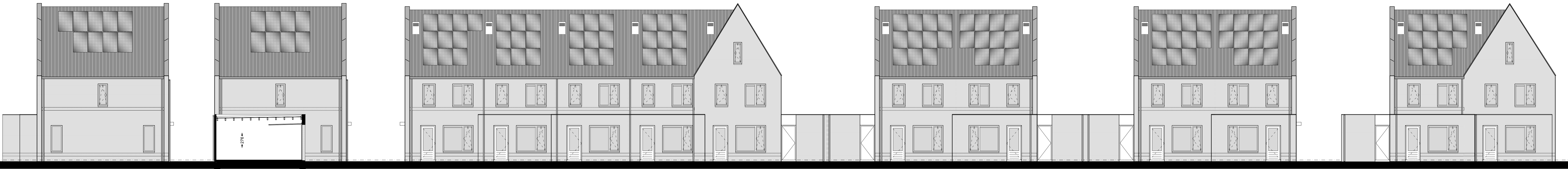
LINKER ZIJEVEL (plots 83-78) and ACHTERGEVEL (plots 73-83)