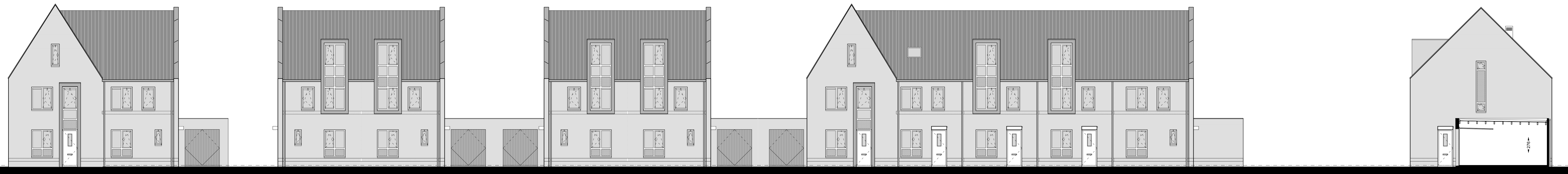
VOORGEVEL (plots 83-73) and RECHTER ZIJEVEL (plots 83-78)